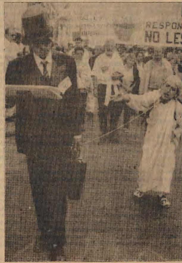
IMF Madrid'te protesto edildi. "Başka Ruandalar istemiyoruz" sloganlarıyla bir temsil canlandırıldı.

Yani emperyalist sistemin maliyesinin başı IMF, işçi ve emekçilere krizin yükünün daha fazla yıkılmasını istiyor; ulusal ve sınıfsal baskılara karşı, sermaye sınıfları arasında "iç barışı sağlamış" olan, dayanaklı hükümet istiyor. Bu istemin hedefi belli; DYP-SHP koalisyonu artık gitsin. Ne mi gel-sin? Onu da öntümüzdeki haftalarda göreceğiz.