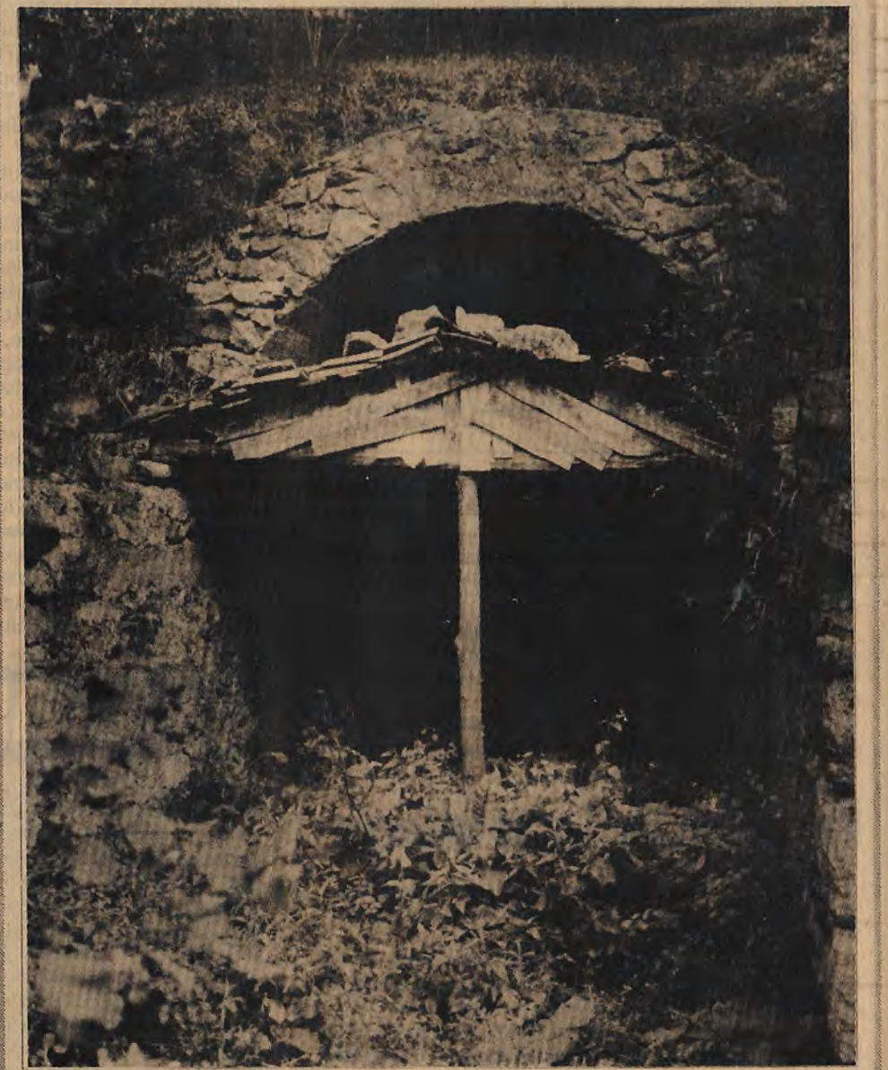
"Zonguldak Fotograf Grubu"

Türk-İş Disiplin Kurulu, sendikayı küçük düşürmekle suçladığı Harb-İş Sendikası'ndan sözlü savunma isteme kararı aldı. Yol-İş Sendikası İstanbul 1 No'lu şube Başkanı Ercan Atmaca'ya da kınama cezası veren Türk-İş, cezanın gerekçesi olarak Ercan Atmaca'nın basına yaptığı açıklamaları gösterdi. Hatırlanacağı gibi, Yol-İş Sendikası'nın 1 No'lu Şubesi'nin telefon ve faksla Türk-İş yönetimi tarafından kesilmiş. Son sendika gangsterleri bu tür aciz yöntemlerle sendikalara göz dağı vererek aktivitelelerini düşürmeye çalışıyor.