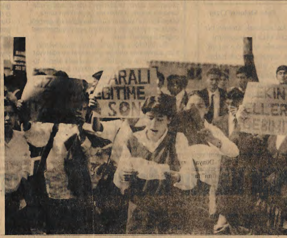
İlkokul öğrencileri, parasız eğitim için eylemde.

tilmesi için 30 Eylül'de eylem geçtiler. Sabah okulun önünde bir basın açıklaması yapıldı. Ancak okul müdürünün; "Bu sorunun muhatabı ben değilim. Milli Eğitim Müdürlüğü'ndür" demesi üzerine, arabalara binilip Çağaloğlu'daki Milli Eğitim Müdürlüğü önüne gidildi. Eylemci ilkokul öğrencilerini karşılarında gören müdür, toz olup kaçınca, müdür yardımcısı kaldı "muhatap" alınacak. Onunla görüşmeye giden 5 kişilik heyet; "öğretmen yok, öğretmenlerinizi kendiniz bulun" cevabı ile karşılaştınca, eylemcilerin hedefi İstanbul Valisi oldu. Ellerinde çeşitli dövizlerle, "Paralı eğitime hayır", "Öğretmen istiyoruz", "Paralar devlete öğretmen nerede" sloganlarını atarak, İstanbul Valiliği'nin önüne yürüdüler. Ne var ki eylem uzun sürmedi. Polisin engel olmasıyla beraber Valiliğin önünde sona erdi. Ancak bir öğrenci velisinin dediği gibi "şimdilik". Minik öğrencilerin dudaklarından ise şu sözcükler dökülüyordu: "Eylemimiz okuma hakkımızı kazanana kadar sürecek."