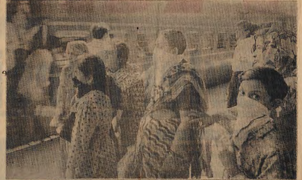
Veba mikrobundan kaçmak için sahip oldukları olanak yalnızca bir peçe

den açığa çıktı. ABD'de de New York, Los Angeles, San Francisco, Seattle, Philadelphia, Pittsburg da azınlık ve yoksul halkın yaşadığı kentlerde, şehir sularındaki bakterilerden dolayı ölümcül bir ishal türü; 1 yılda 100 kişinin ölümüne, 400 bin kişinin ağır hastalanmasına neden oldu. Şu an Kuveyt ve İngiltere'de "veba" teşhisi konan birçok hasta karantinaya alınırken, Hindistan'da bu rakam binleri geçti. Sadece son 2 hafta içerisinde Hindistan'da, 300 kişi "veba"dan dolayı ölüyor, 4000 kişi de karantina altına alındı. İlk olarak MÖ. 9-10. yy'da ortaya çıkan veba (halk dilinde kara ölüm) 6 yy'da I. Justinien Devri'nde Bizans İmparatorluğu'nda tekrar ortaya çıktı. 14. yy'da Avrupa nüfusunun 1/4'ünün ölümüne yol açan hastalık; 1894 yılında Hindistan'da başlayarak, Büyük Okyanusu geçip Amerika'ya, hatı Çin'e kadar ulaşıp, 10 milyon insanın ölümüne yol açtı. Yıl 1994 yine "Kara ölüm" haberleri Hindistan'da başladı. İngiltere ve Kuveyt'e kadar yayıldı. Hindistan'da veba salgını ile ilgili duyular açığa çıktığı ilk dönemlerde Sağlık