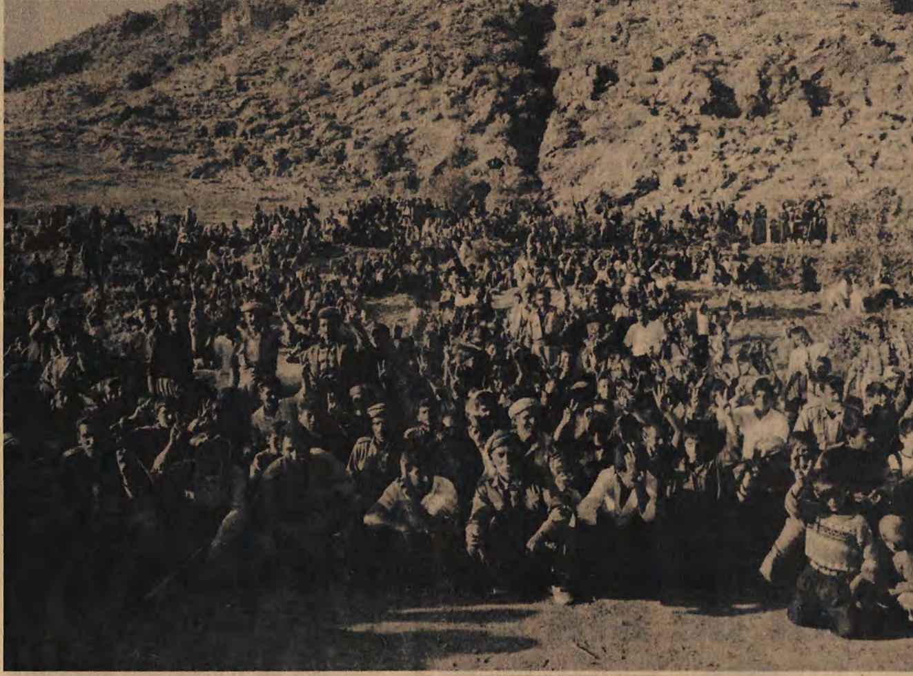
Yıkım, katliam ve yurtsuzluğun reva görüldüğü Kürt halkı bu "makus talih"ini ancak mücadeleye daha sıkı sarılarak yenebilir