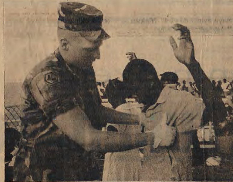
ABD emperyalizmi tıpkı Somali'de olduğu gibi Haiti'de de yenilmeye mahkumdur.

ABD'nin Haiti'yi işgalinden sonra yoğunlaşan olaylar sürüyor. Haiti'deki Amerikan askerlerinin varlığını meşurlaştırmanın bir aracı olarak görülüyor. ABD askerleri ve CIA tarafından yönlendirilen çatışmalarda, şimdiye dek yüzlerce kişi yaralandı.