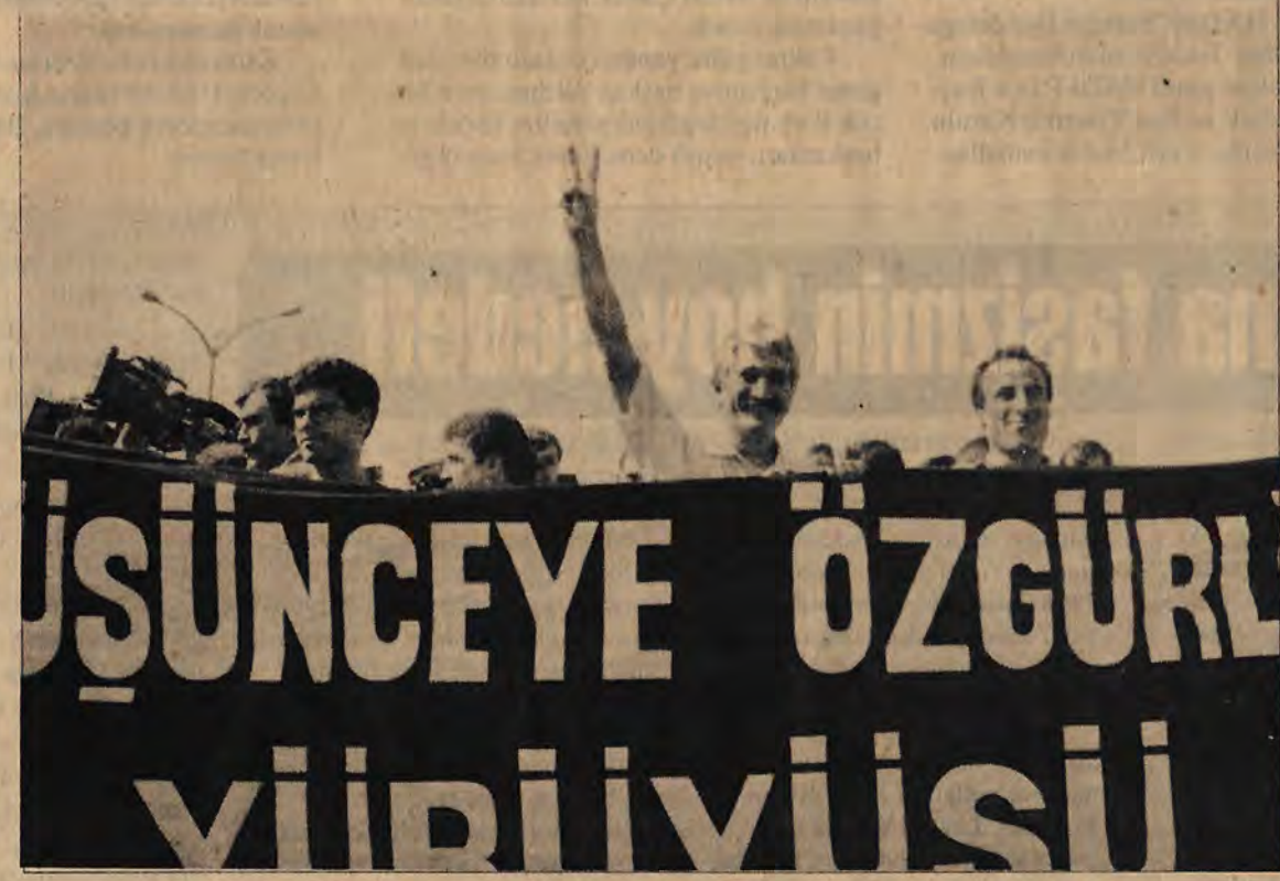
Yürüyüşçülerin pankart açması sivil polislerce engellemeye çalışıldı.

İHD ve ÇHD başlattıkları, "Düşünceye özgürlük" kampanyası çerçevesinde, İstanbul'dan Ankara'ya bir yürüyüş düzenlediler. 29 Eylül'de başlayan yürüyüş, 2 gün sürdü, Ankara Merkez Kapalı ve Haymana Cezaevleri ziyaret edildi. Terörle Mücadele Yasası'nın 8. maddesinin kaldırılması için TBMM'ne 30 bin imza verildi.