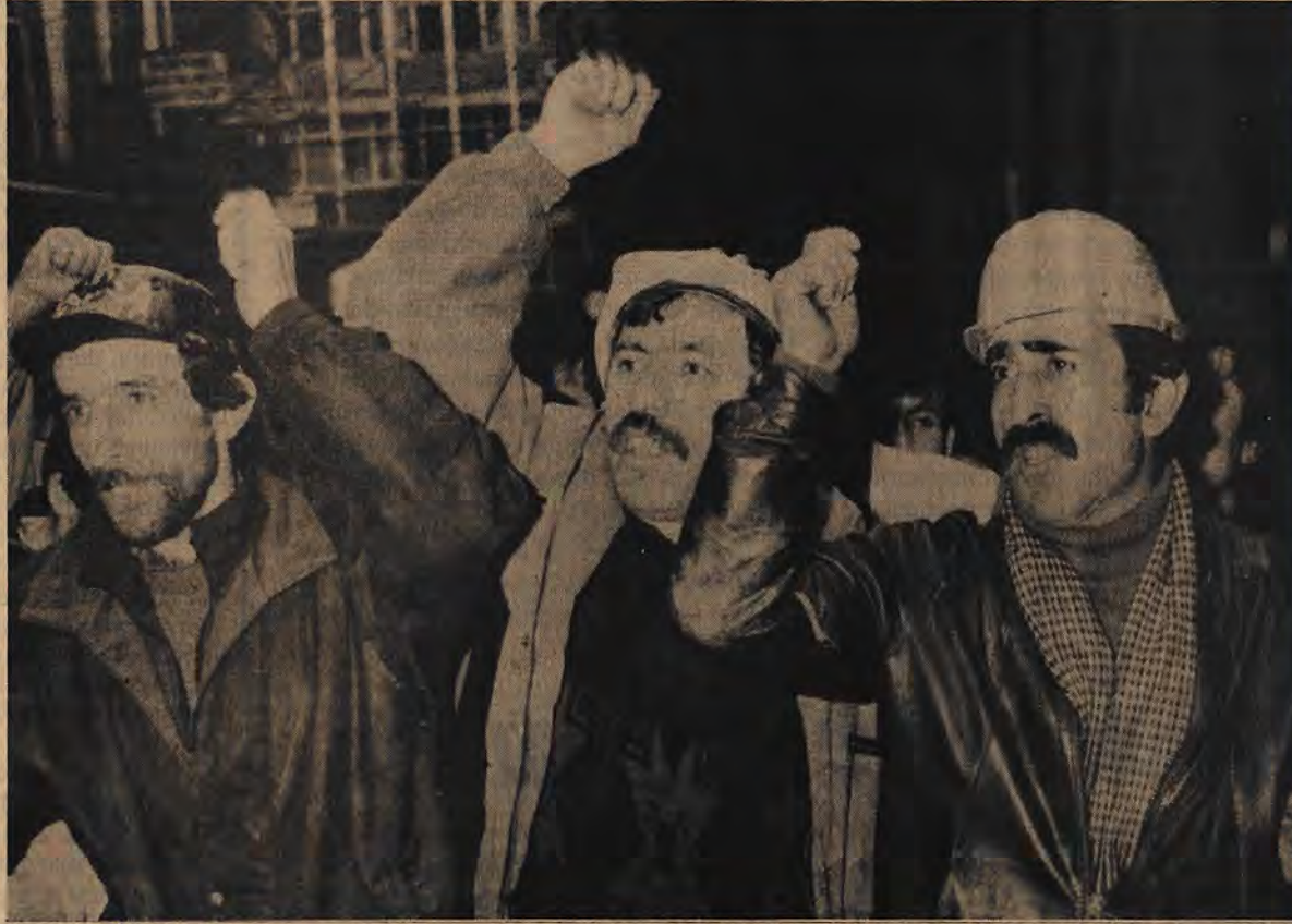
İşçiler kendisi için sınıf olma bilincine eriştikleri anda sınıflar mücadelesinin gerçek öncüsü haline gelebilirler

Olan şudur; uzun dalgalı ve şiddetle derinleşen krizini yaşayan kapitalist-emperyalistler yeni pazar arayışları sa-