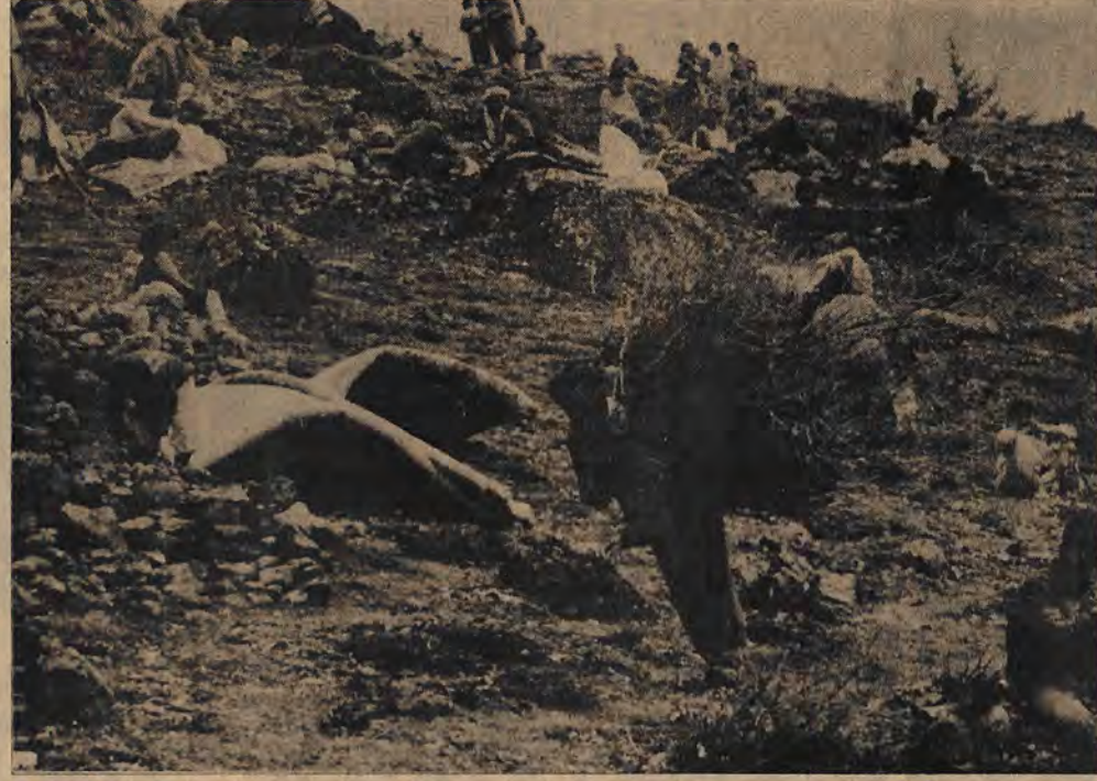
İstanbul'daki Dersimliler, Dersim'deki vahşete karşı herkes sesini yükseltmelidir dediler.

Bölgeye 10 binden fazla asker yığan faşist diktatörlük, ikinci bir Dersim Katliamı yapmaya hazırlanıyor. Uçaklar ve helikopterlerle, bombalanan ormanlar alev alev yanıyor. Bölgeye giriş ve çıkışların yasaklandığını bildiren yerel kaynaklar 147 köyün kesin olarak yakılıp-yıkılarak boşaltılacağı kararının alındığını belirtiyorlar.